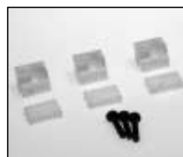
L4.80113.E Reflector mounting Reflektorlager