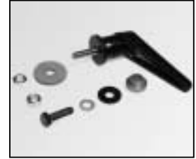
L4.77249.E Stirrup mounting set Bügelbefestigungs-Set