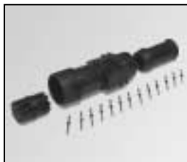
L4.76834.E Schaltbau connector (female) 13 pins Schaltbaustecker (Buchsenkontakt) 13-polig MULTICORE