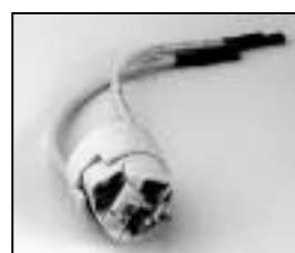
L4.73353.E Lampholder Lampenfassung