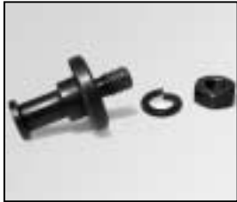
L4.79836.E Spigot Aufhängezapfen