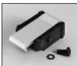
L4.79747.E Door catch Set Schnapphaken-Set