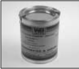
L4.70189.E Paint silver metallic similar RAL 9011 Lack silber metallic ähnlich RAL 9011