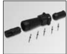
L4.76829.E Schaltbau connector (female) 5 pins Schaltbaustecker (Buchsenkontakt) 5-polig