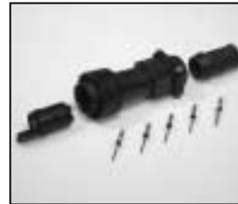
L4.76828.E Schaltbau connector (male) 5 pins Schaltbaustecker (Stiftkontakt) 5-polig