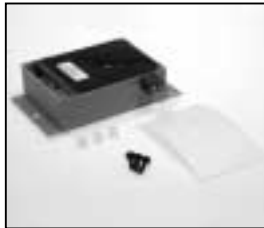
L4.80067.E Ignitor Zündgerät