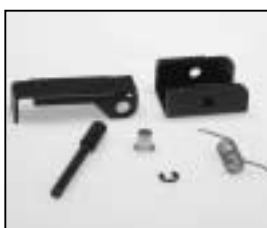
L4.80022.E Top latch Verschlussklaue