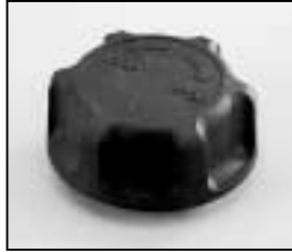
L4.79036.E Focus knob Fokusknopf