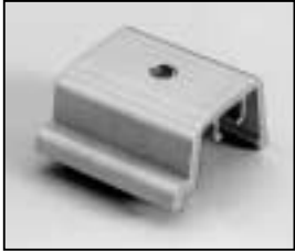
L4.77929.E Stirrup bracket Bügelhalter