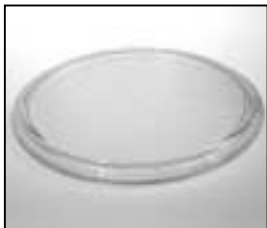
L4.77829.E N-flood lens 10x20° (small rectangle) "black" 130mm N-Floodlinse 10x20° (kleines Rechteck) "schwarz" 130mm