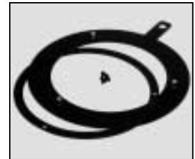
L4.70478BE Lensring spot "blue" Linsenring Spot "blau"