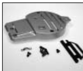
L4.80093SE Rear casting silver Rückteil silber