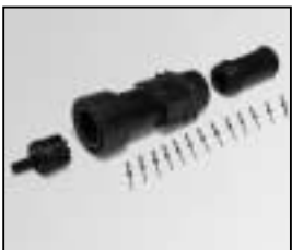
L4.76833.E Schaltbau connector (male) 13 pins Schaltbaustecker (Stiftkontakt) 13-polig MULTICORE