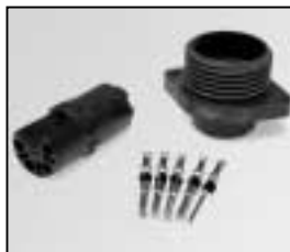
L4.76836.E Female connector 5 pins Flanschdose (Schaltbau) 5-polig SPLITBOX