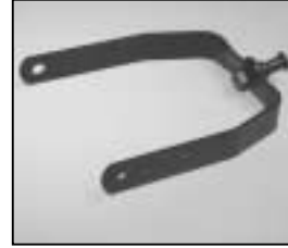
L4.80024XE Stirrup black Haltebügel schwarz