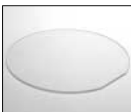
L4.80081.E UV-protective glass UV-Schutzscheibe