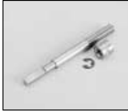
L4.77842.E Focus spindle Fokusspindel