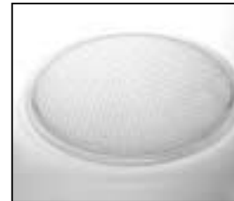
L4.77833SE S-flood lens frosted 50° (honey-comb) "silver" 130mm S-Floodlinse gefrostet 50° (Bienenwabe) "silber" 130mm