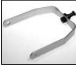
L4.80024SE Stirrup silver Haltebügel silber