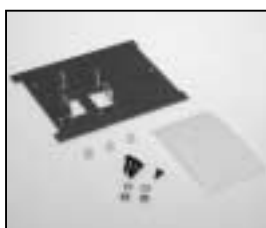
L4.80014.E Intermediate panel Zwischenblech