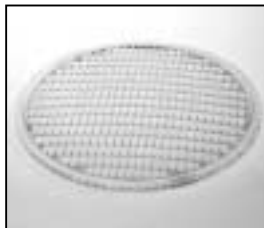
L4.77831.E Flood lens 20x45° (large rectangle) "green" 130mm Floodlinse 20x45° (großes Rechteck) "grün" 130mm