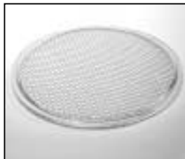
L4.77833.E S-flood lens clear 50° (honey- comb) "red" 130mm S-Floodlinse klar 50° (Bienenwabe) "rot" 130mm