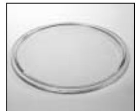
L4.77827.E Spot lens 10° (flat structure) "blue" 130mm Spotlinse 10° (flache Struktur) "blau" 130mm