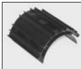
L4.77837XE Top cover black Deckel schwarz