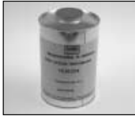
L4.70186.E Paint thinner Farb-Verdünnung