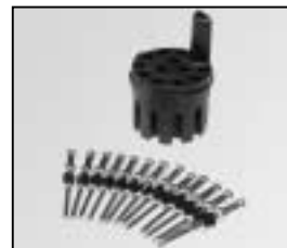
L4.76838.E Male connector 13 pins Flanschstecker (Schaltbau) 13-polig SPLITBOX