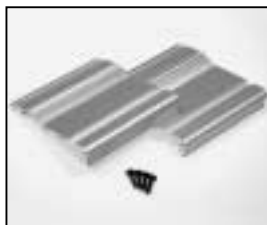
L4.80059.E Set of side panels silver Set Seitenbleche silber