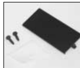
L4.80048XE Bottom plate black Bodenblech schwarz