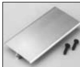
L4.80048.E Bottom plate silver Bodenblech silber