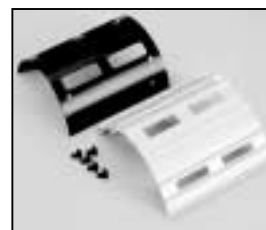
L4.77837.E Top cover silver Deckel silber