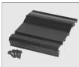
L4.80059XE Set of side panels black Set Seitenbleche schwarz