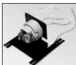
L4.77069.E Lampholder + lamp carriage cpl. Lampenfassung + Fassungsträger kpl.