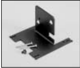
L4.77935.E Lamp carriage Fassungsträger