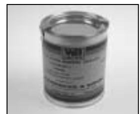
L4.70183.E Paint black similar RAL 9011 Lack schwarz ähnlich RAL 9011