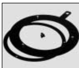
L4.70478RE Lensring s-flood "red" Linsenring S-Flood "rot"