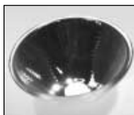
L4.74952.E Glass reflector Glasreflektor