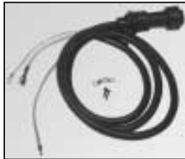
L4.80045.E Mains cable Scheinwerferkabel