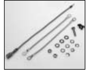
L4.80209.E Connecting wire Verbindungsdrähte