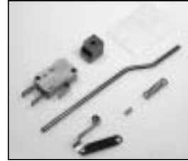
L4.80007.E Safety switch Sicherheitsschalter