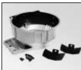
L4.80023SE Front casting silver Frontteil silber

NOTE: WHEN ORDERING QUOTE PART NUMBER BEMERKUNG: BEI BESTELLUNG IDENT.-NR. ANGEBEN