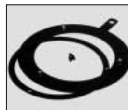
L4.70478SE Lensring s-flood frosted "silver" Linsenring S-Flood gefrostet "silber"