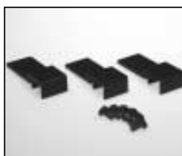
L4.80012.E Set of accessory brackets Set Torhalter