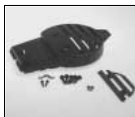
L4.80093XE Rear casting black Rückteil schwarz