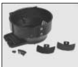
L4.80023XE Front casting black Frontteil schwarz